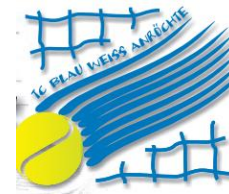
Tenniscamp Koper Ostern 2022