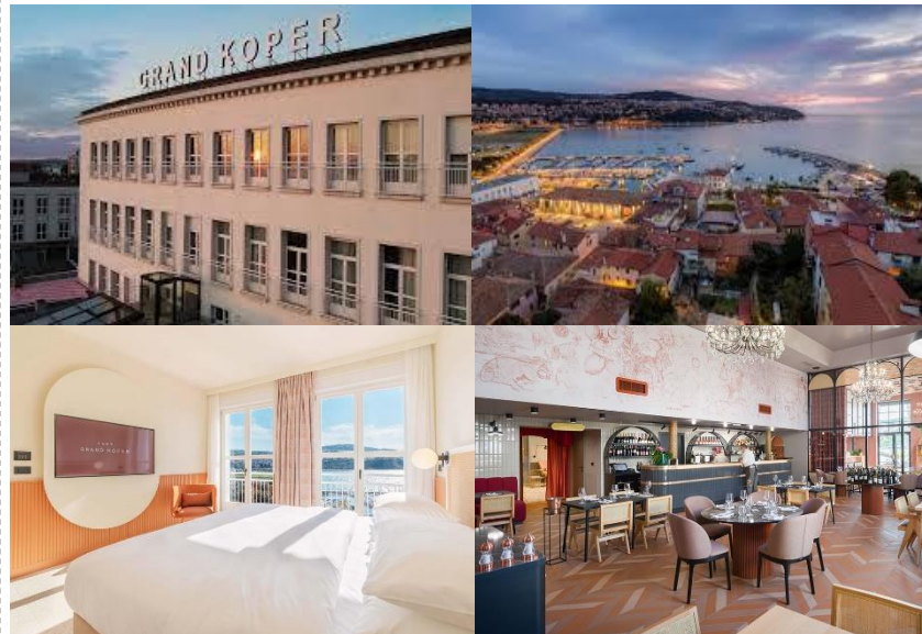
Tenniscamp Koper Ostern 2022

Nicht Tennisspieler zahlen nur die Hotelkosten